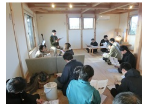
モデルハウスでの説明