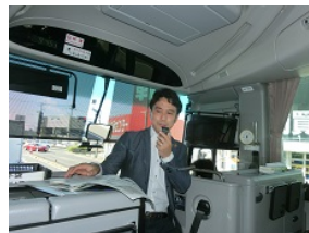
池田氏からの説明