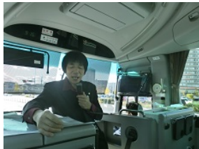
海藤氏からの説明