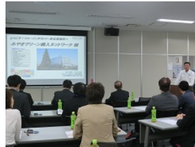
事業所長からの説明