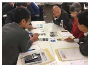
カード使用してのゲーム