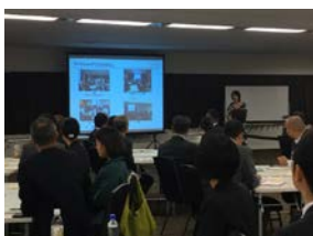
SDGs についての基本講演